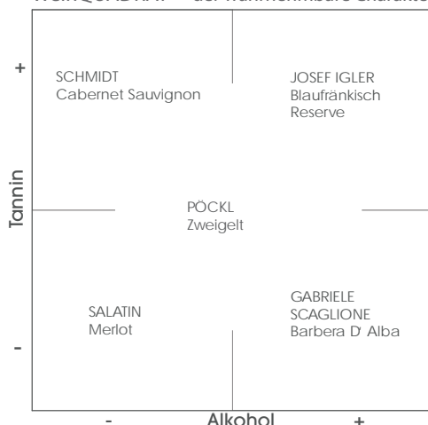
WeinQUADRAT - der wahrnehmbare Charakter