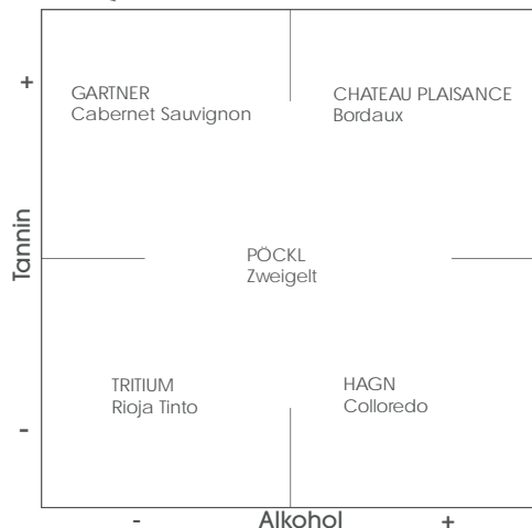
WeinQUADRAT - der wahrnehmbare Charakter