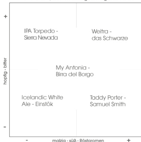
Das BIERQUADRAT für gemäßigte CRAFTs

die White Ale Einstök ze Mariage Parfait warzmann Rieder Wonderland Thornbridge y Antonia a del Borgo Shipwreck CRAFTbeer