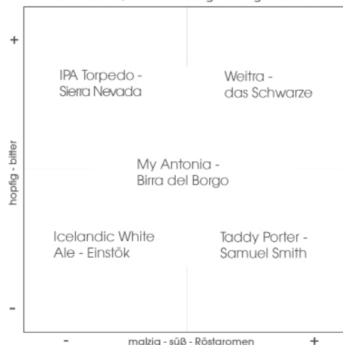
Das BIERQUADRAT für gemäßigte CRAFTs

die White Ale Einstök ze Mariage Parfait warzmann Rieder Wonderland Thornbridge y Antonia a del Borgo Shipwreck CRAFTbeer